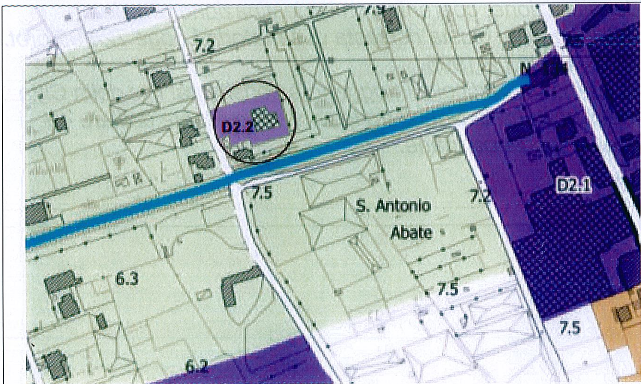
ZONIZZAZIONE PUC (Osservazione)