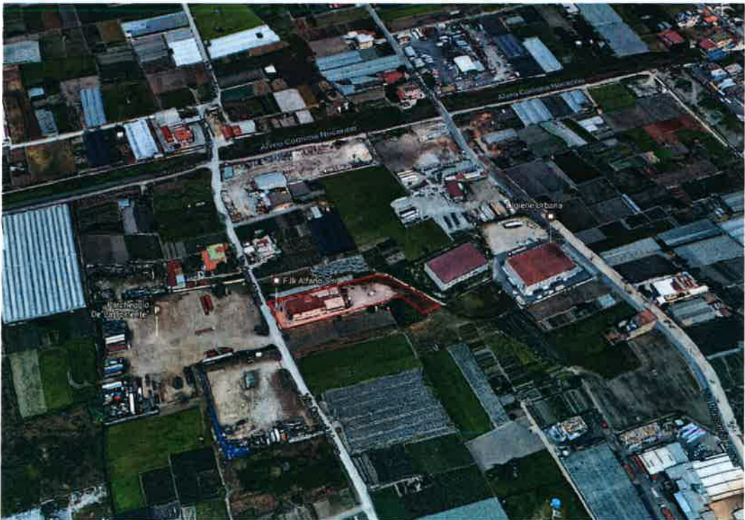
Fig. 1.2 – Inquadramento dell'area oggetto di osservazione